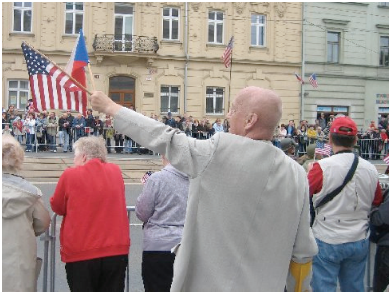
lining the streets of Pilsen for miles.