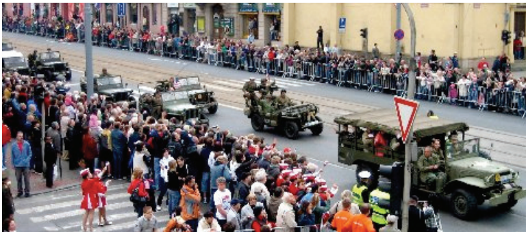
From large crowds...